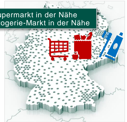
Supermarkt in der Nähe Drogerie-Markt in der Nähe